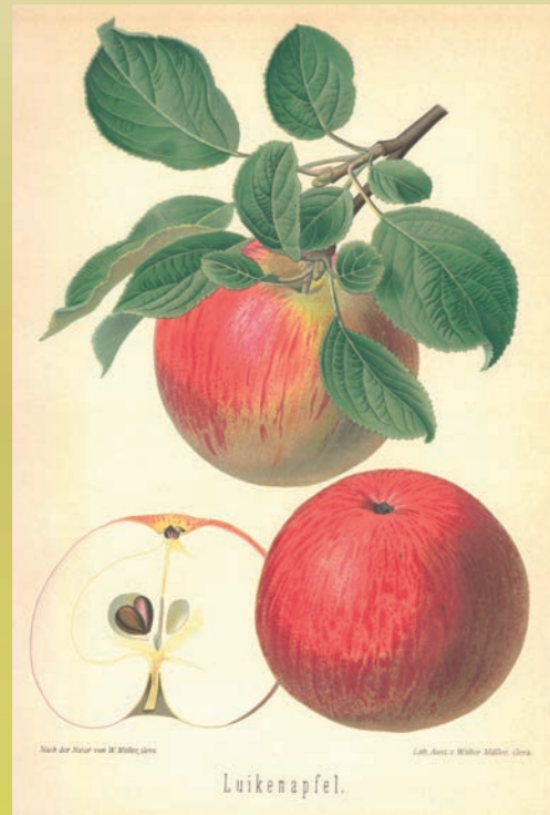
Aus „Deutsche Kernobstsorten“, Goethe, Degenkolb und Mertens, Verlag A. Nügel, Gera

Einerseits können die Sorten durch Nachpflanzungen verbreitet werden. Andererseits können alte Bäume durch Pflege wieder erneuert und genutzt werden. Um die Streuobstbestände dauerhaft zu erhalten ist vor allen Dingen eine regelmäßige Pflege notwendig.